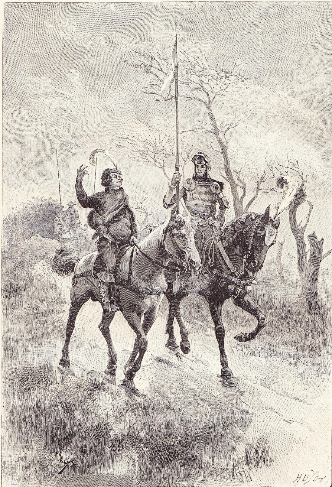
Sire Aymar et Bertrand se rendant au château de Douglas.